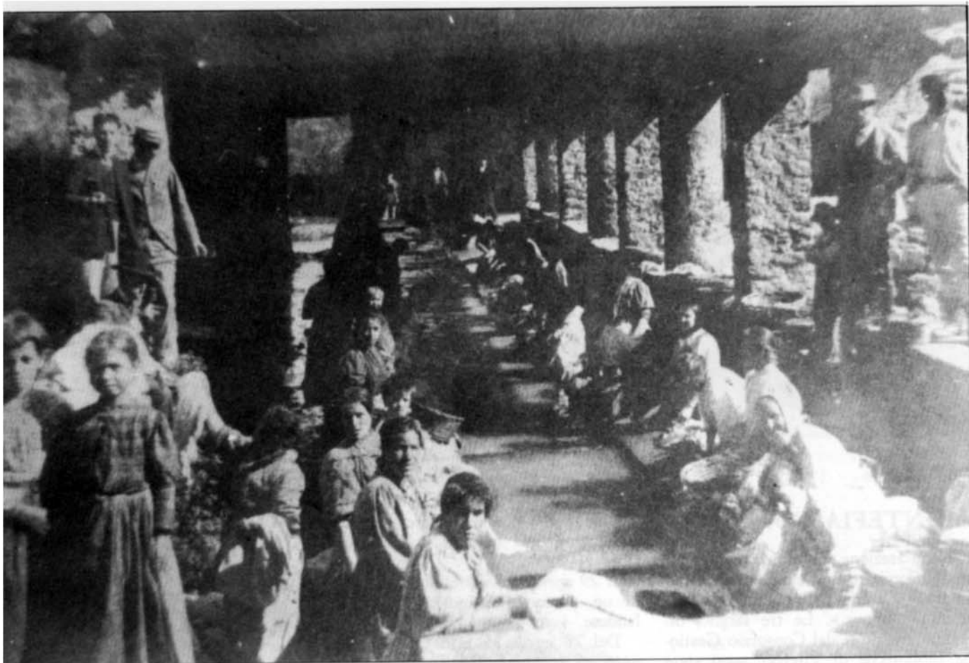
L'ex lavatoio pubblico sotto la fontana di «Papacqua» agli inizi del 1900.